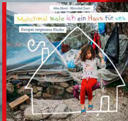
Abbildung aus © Alea Horst aus „Manchmal male ich ein Haus für uns“, Klett Kinderbuch 2022